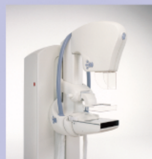
デジタルマンモグラフィ装置